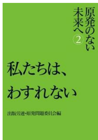
2号 2013年5月14日発行 特集：柳町秀一「原発の根本問題に答える」 必見：原発関連年表