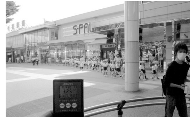
2011.7 福島駅前（測定値 3.25μSv は右端男性の足もとと植え込み表面の放射線量）