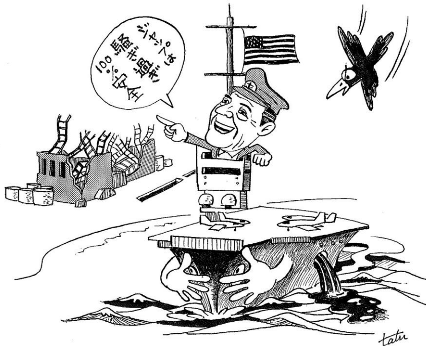
ロナルド・レーガンの暴言